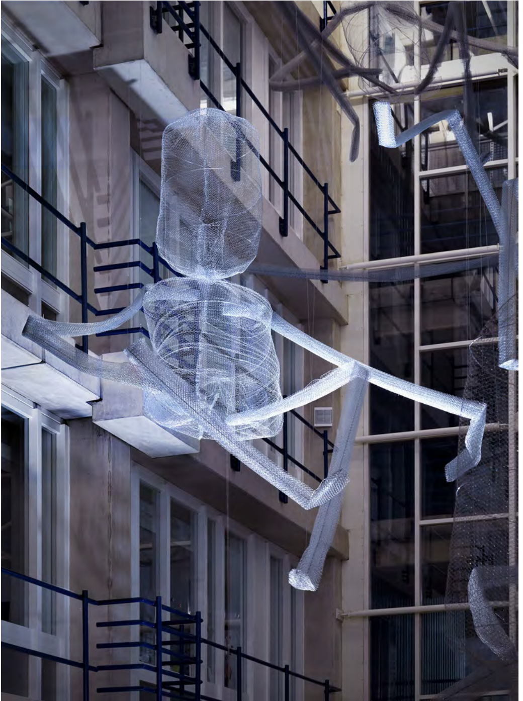
Antoinette Nausikää, Sometimes you see it, Sometimes you don't , LUMC 2014