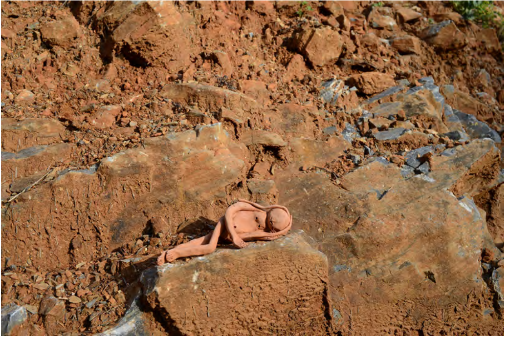
Antoinette Nausikää, Clay Sculpture on red Stone, mt Olympus , 2014