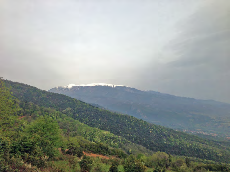
Antoinette Nausikaä, mt Olympus , 2014

gone, the mountain appears (2013). De afgelopen maanden werkte zij met twee andere heilige bergen, twee en een halve maand op de Olympus en anderhalve maand bij de Ararat.