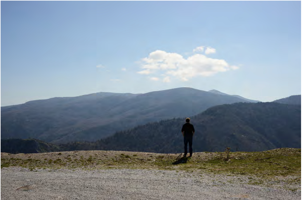
Antoinette Nausikää, Cloud above a Man, mt Olympus , 2014