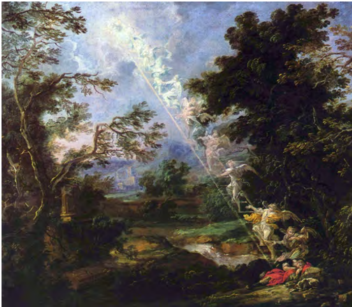
Michael Willmann (1630–1706), Jakobs droom , 1691

'Het begin is de ruimte. Ik werk altijd met vaste elementen, waarmee ik de ruimte maat, schaal en betekenis geef. De maat van de gaswezens, 8 meter, had ik voor deze ruimte al bedacht. In een maquette van de ruimte had ik wat figuurtjes gehangen om een indruk te krijgen van de maatverhouding en van de ruimtelijke ervaring die ik wil overbrengen: diagonaal van boven naar beneden, als een soort ladder naar de grond of andersom. Zoals in de bijbel aartsvader Jakob in zijn droom engelen uit de hemel zag afdalen en weer opgaan [Genesis 28:12] en in het Nieuwe Testament Johannes eenzelfde beschrijving geeft [Joh. 1:51]. Zo'n visioen had ik voor de beeldentuin en vond op internet een afbeelding van een schilderij dat me inspireerde.