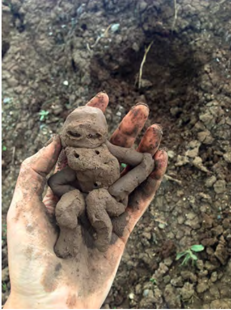
Turks kleifiguurtje van de berg Ararat

ontzag inboezemende presentie van en op de aarde; ontmoeting van vergankelijkheid en eeuwigheid.