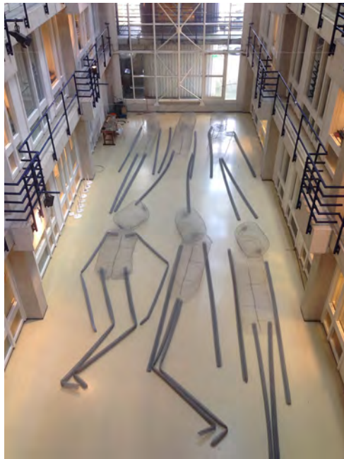
Tijdens het werk