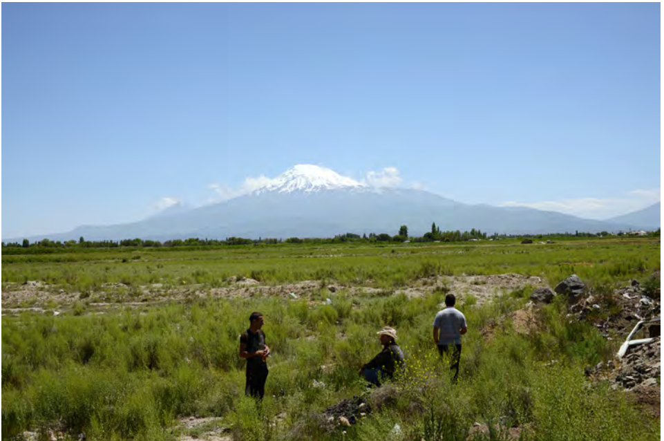
Antoinette Nausikaä, Three Men and mt Ararat, Armenia , 2014

'De Ararat; dat is een heel ander verhaal. Die berg vroeg erom eromheen te rijden. De berg is meer dan 5000 meter hoog en ligt in een verlaten grensgebied tussen Turkije, Armenië en Iran. Bij de Olympus wilde ik stil zitten. Bij de Ararat wilde ik er omheen. Toen kwam ik erachter dat je dan eerst door Turkije moet, dan door Armenië en dan Iran. Dat is een gigantisch avontuur geworden. We waren met de auto. De benodigde visa hebben we daar kunnen regelen. In Turkije ben ik begonnen, van hier zie je de grote Ararat links liggen en rechts ervan de kleine. Vanuit Armenië is het andersom. In ieder land heeft die berg een andere naam. Ik heb het opgezocht op internet. In het Turks heet de berg Ağrı Dağı , de berg van pijn; de Koerden noemen hem de zurige berg , omdat het eens een vulkaan was die ooit weer wakker kon worden en dan vuur zou spuwen. De Armeniërs noemen de berg Masis , de Moederberg.'